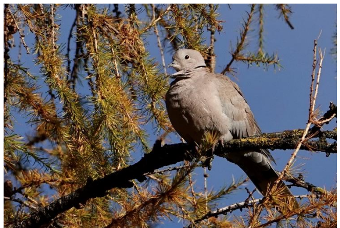
Türkentaube im herbstlichen Licht

Bei Sonnenschein – der allerdings nicht bis zum Weg entlang des Schifffahrtskanals gelangte – und malerisch schönen Herbststimmungen bot sich den Beobachterinnen und Beobachtern eine breite Palette von Vögeln: fünf Meisenarten, ein Wintertrupp Schwanzmeisen, Erlenzeisige, Türkentaube, Wasseramsel und Eisvogel. Die Wasserralle rief aus dem Schilf des Schutzgebiets. Wohl zeigten sich Schwarzhalstaucher in Ufernähe, der auffrischende Wind hatte aber den See aufgeraut, wodurch das Beobachten der Wasservögel erschwert wurde. Insgesamt präsentierten sich 33 Arten. Danke Seppi für die gut vorbereitete, sehr schöne Exkursion. UW