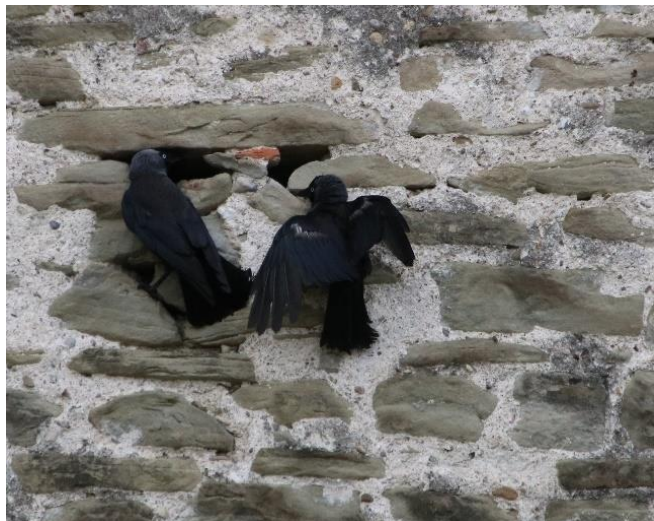
Ein Dohlenpaar in der Mauser nach der Brutzeit an der Museggmauer