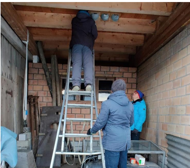
Das Team Sonnenberg bringt mit vereinten Kräften neue Kunstnester am richtigen Platz an.

Im April kam dann die grosse Ernüchterung: nur wenige Rauch- und Mehlschwalben kehrten aus dem Süden auf den Sonnenberg zurück. Auch wenn die mündlichen Berichte der Landwirte darauf hinwiesen, dass einige besetzte Nester während den vier Monitoring-Runden unentdeckt blieben, so bestätigten sie auch, dass sich ihre Beobachtungen mit unseren deckten. Das Schwalbenjahr 2022 auf dem Sonnenberg war miserabel. Während die Zahl der besetzten Rauchschwalbennester nur geringfügig niedriger war als im Vorjahr, brach die Zahl der besetzten Mehlschwalbennester um mehr als die Hälfte ein. Dies ist besonders schade, da die Voraussetzungen für einen guten Bruterfolg eigentlich gegeben waren: der Frühling war warm aber nicht zu trocken. Immerhin blieben die Verluste auch während des heissen Sommers klein. Früher als in den Vorjahren endete die Brutsaison – ohne dass in den neuen Kunstnestern auf dem Eggenhof je eine Schwalbe gebrütet hatte. DT