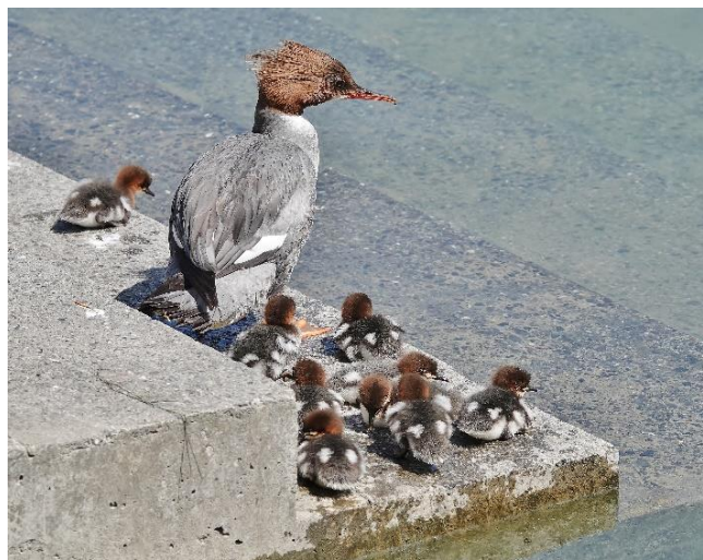
Gänsesägerweibchen mit 9 Pulli in der Nähe des Nordpols