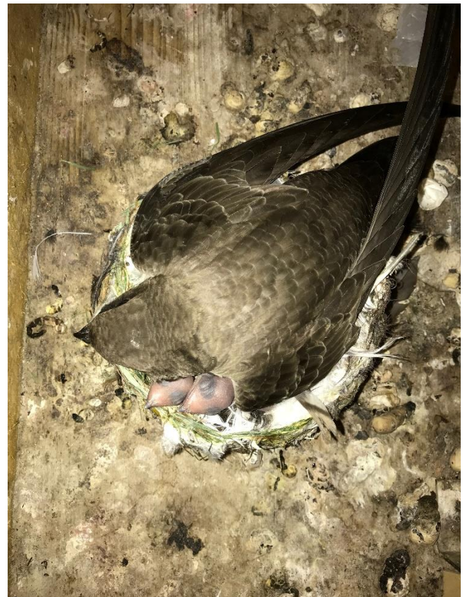
Alpensegler mit zwei frisch Geschlüpften