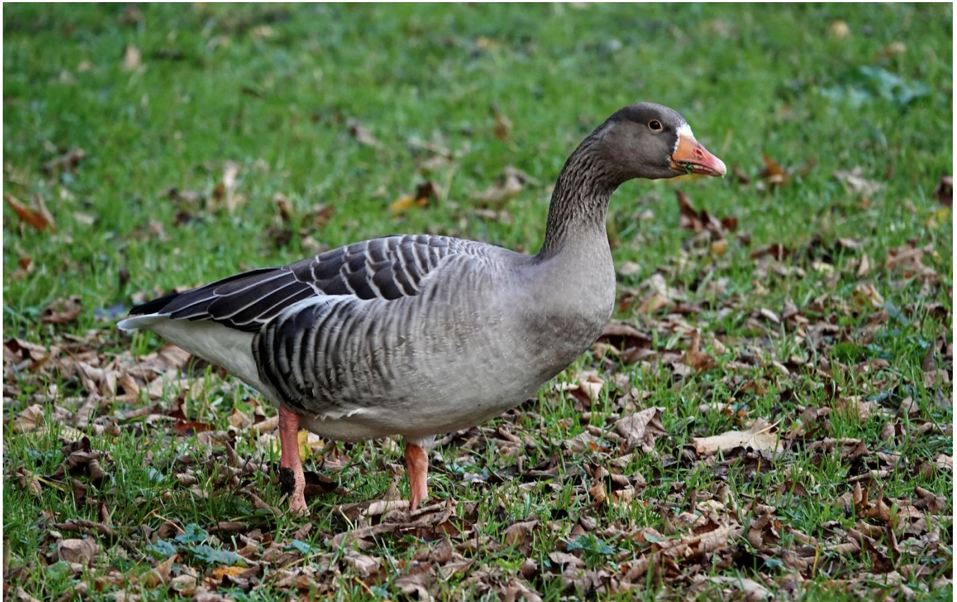
Graugans bei Interlaken

Wir danken allen Gönnermitgliedern für die grosszügigen Beiträge!