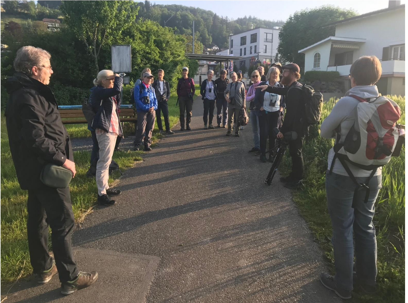
Begrüßung der Kursteilnehmer zur letzten Exkursion des Ornithologischen Grundkurses 2022