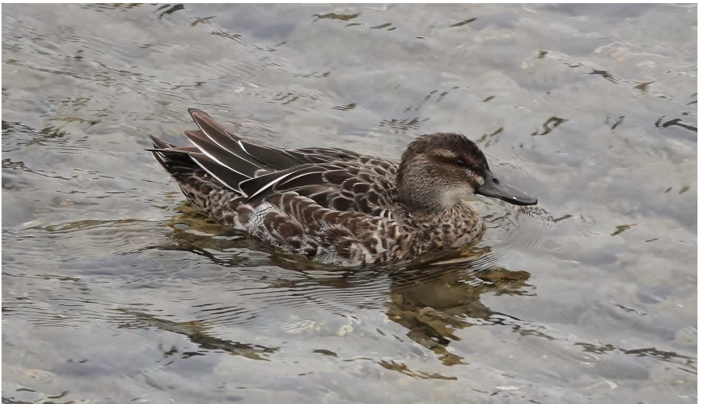
Knäkente auf dem Luzerner Reussabschnitt

Ein herzlicher Dank geht an alle Mitwirkende. UW