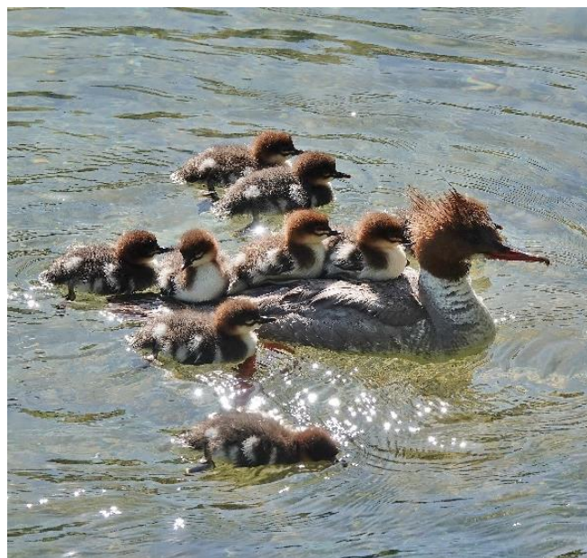
Immer in der Nähe oder auf dem Rücken der Mutter bleiben! Gänsesägerweibchen mit ihren Jungen