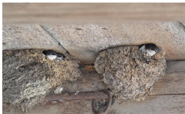
Junge Mehlschnalben warten geduldig auf Futter