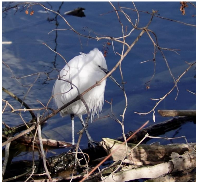
Ein Seidenreiher präsentiert sich in Ufernähe.

Wir trafen uns am linken Uferweg am Klingnauer-Stausee, ausgehend vom Bahnhof Döttingen. Trotz Sonne blies uns ein kräftiger und kalter Wind um die Ohren. Schon bald liess sich der Eisvogel beobachten und immer wieder waren wir fasziniert von seiner schillernden Schönheit. Wir beobachteten viele Wintergäste, vor allem Krick-, Schnatter-, Spiess- und Löffelenten. Eine Rohrammer und zwei Wasserrallen liessen sich kurz blicken.