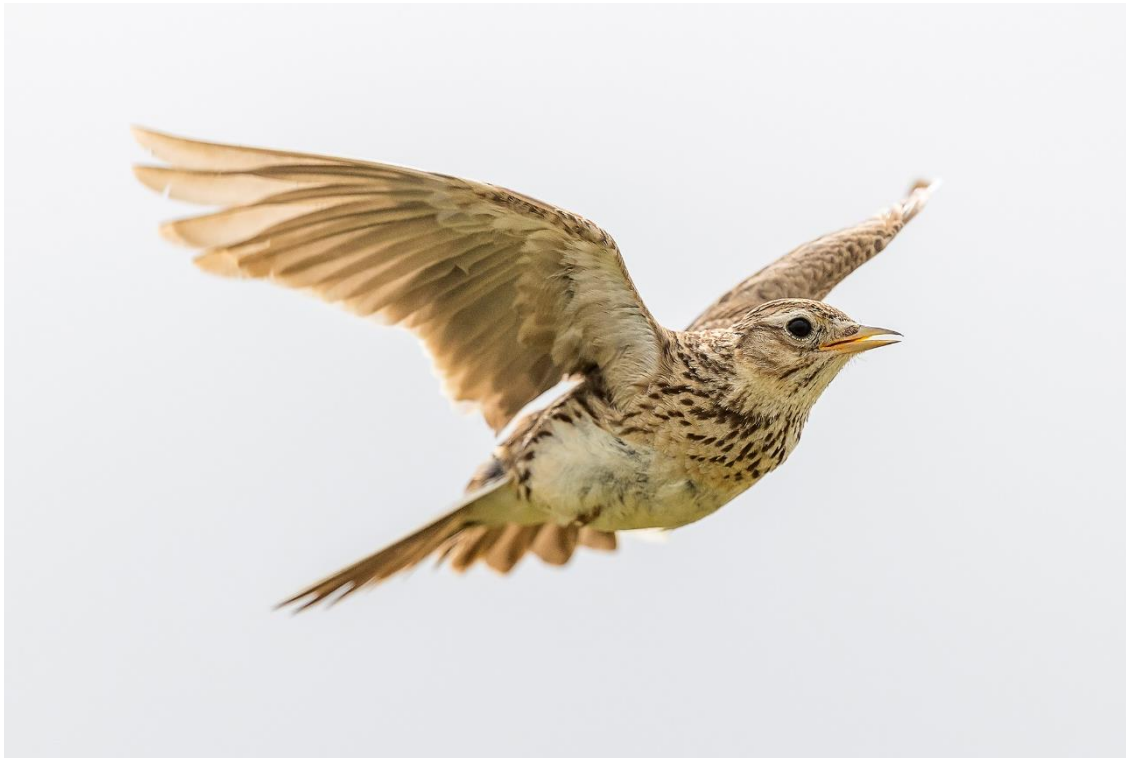
Feldlerche – Vogel des Jahres 2022