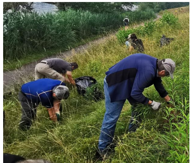
Das Team bei der Arbeit