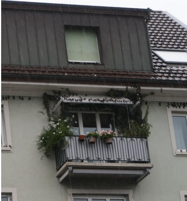
Gestrandete Mehlschwalben in Luzern

Der abrupte Kälteeinbruch vom 29. September verursachte einen Stau bei den Zugvögeln: Tausende Schwalben strandeten in der Stadt Luzern und suchten Schutz an Hausfassaden und unter Dachvorsprüngen. Über dieses Spektakel berichtete das Schweizer Fernsehen SRF in der Sendung Schweiz Aktuell.