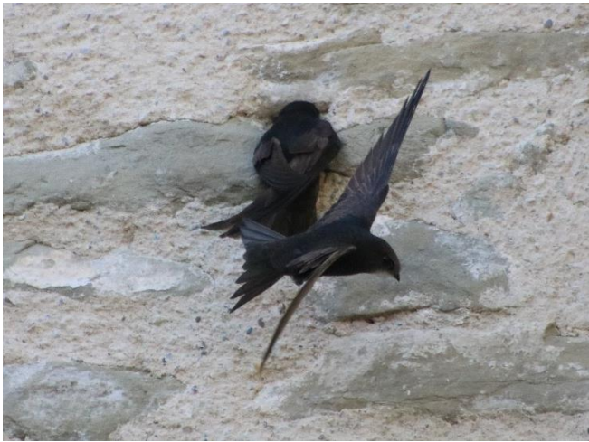
Mauersegler an der Museggmauer