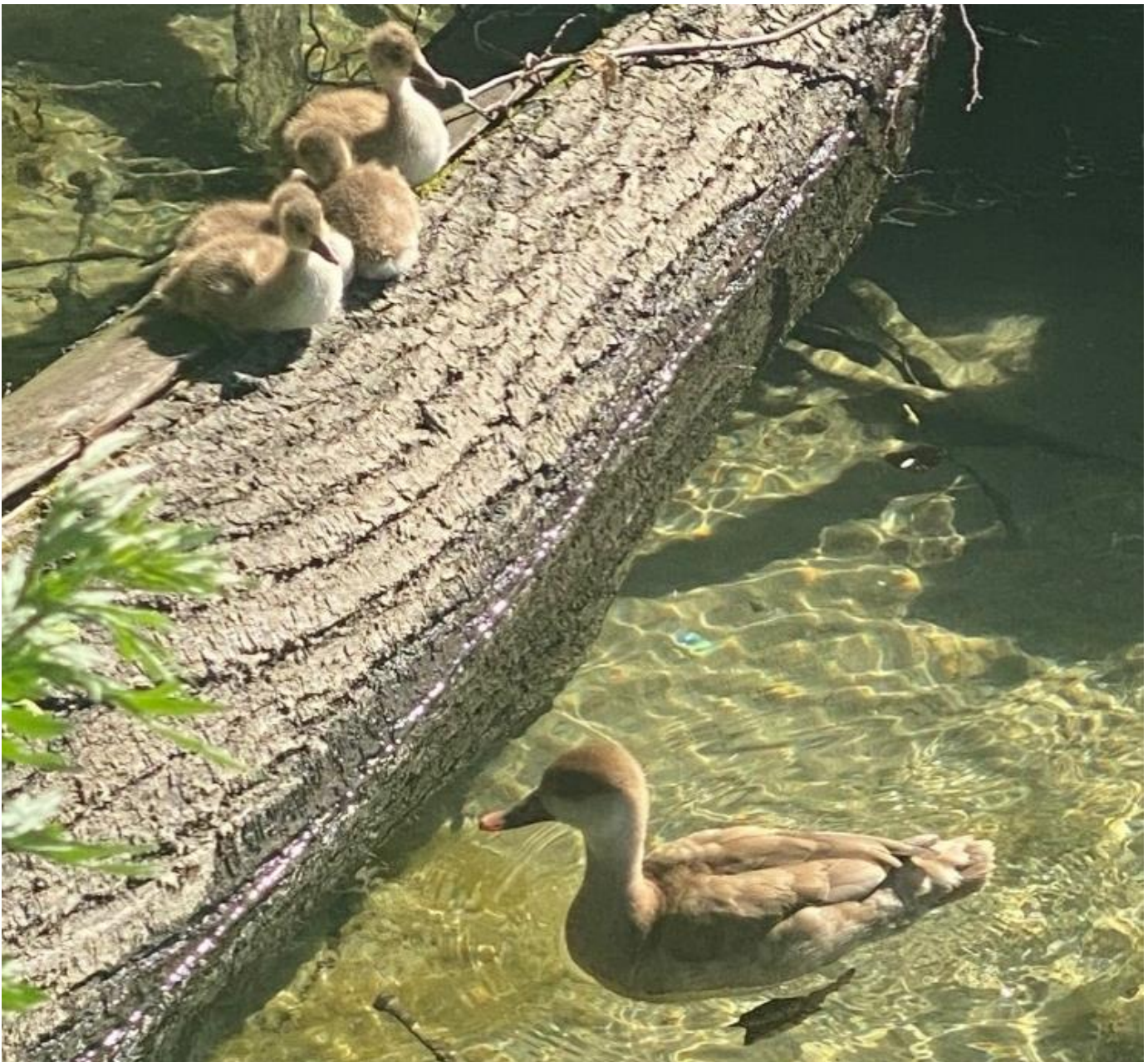
Kolbenentenweibchen mit Jungen

Diese Auswertung beinhaltet die Sichtungen des Teams sowie die Einträge von Drittpersonen in Ornitho.ch. Auf der rechten Seeseite fand keine regelmässige Begehung statt. Ein herzliches Dankeschön dem ganzen Team und allen, welche Kolbenenten-Familien in Ornitho.ch erfasst haben! AB/LVD