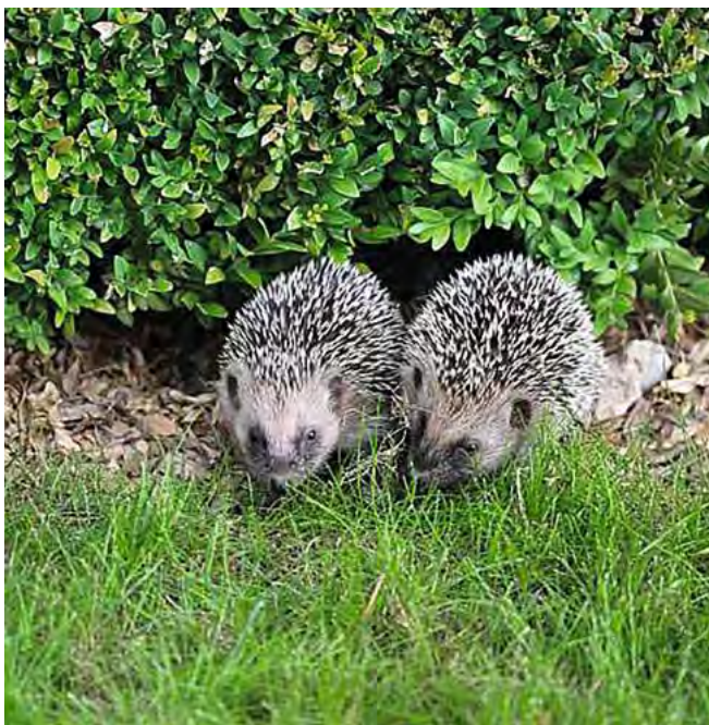
Igelpärchen in der Stadt Luzern

Die OGL unterstützte gemeinsam mit den Umweltverbänden Pro Natura, WWF und dem Naturmuseum Luzern die Kampagne Igel gesucht . Diese wurde von der Stadt Luzern und dem in mehreren Schweizer Städten aktiven Verein StadtWildTiere organisiert. Mit Hilfe der Bevölkerung wurde untersucht, in welchen städtischen Quartieren die Igel gute Lebensbedingungen vorfinden und wo sie bereits verdrängt wurden. Auf der neu errichteten Webplattform http://luzern.stadtwildtiere.ch erfassten Bürgerinnen und Bürger ihre Beobachtungen von Igel und anderen Wildtieren in der Stadt.