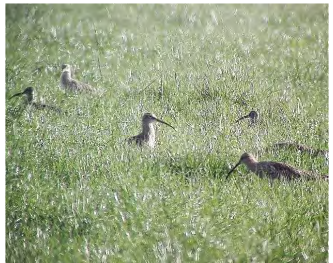
Grosse Brachvögel im Nuolener Ried