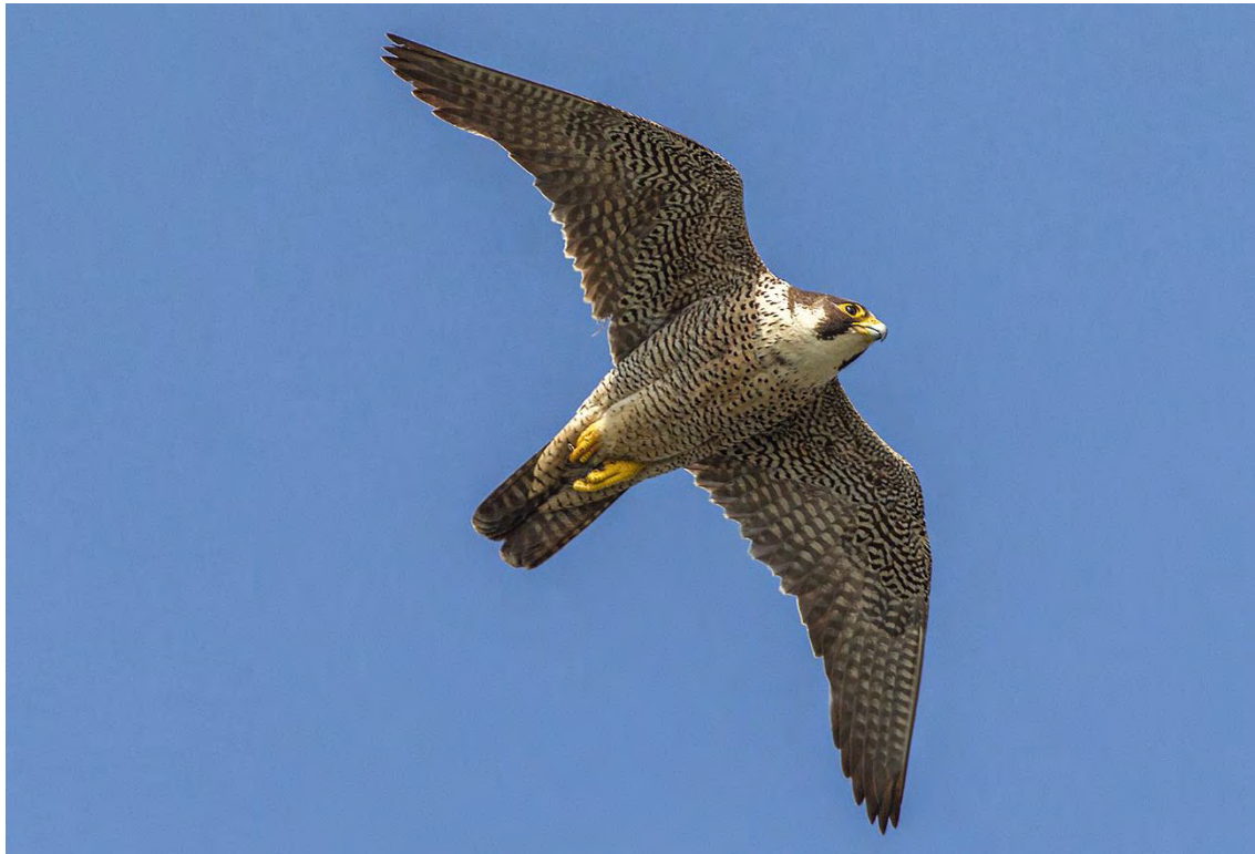
Wanderfalke – Vogel des Jahres 2018