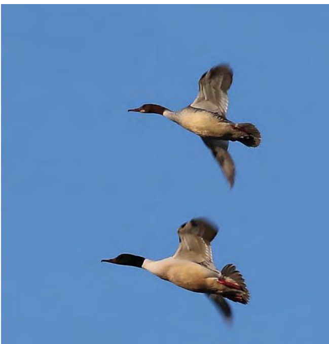
Gänsesägerpaar im Flug

zweimal durch zwei verschiedene Weibchen gebrütet wurde. Am 11. Juni hat die Wasserpolizei Luzern 20 und am 11. Juli weitere 5 gesunde, halbwüchsige Jungvögel, die in der Vogelwarte aufgezogen wurden, am Bürgenstock ausgesetzt. Herzlichen Dank allen Helferinnen und Helfern! UP