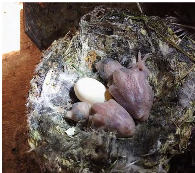
Frisch geschlüpfte Alpengregler-Nestlinge