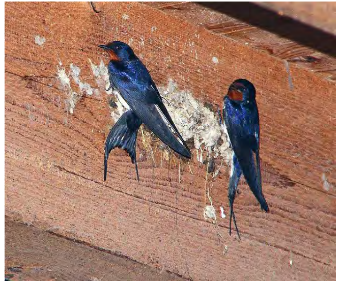
Nestbau der Rauchschwalben im Utenberg

Eine Woche nach den Rauchschwalben erschienen auch die Mehlschwalben auf dem Sonnenberg. Es blieben aber über lange Zeit nur wenige. Die guten Resultate des letzten Jahres konnten nicht wieder erreicht werden. Das erstaunt nach dem guten diesjährigen Resultat der Rauchschwalben. DT