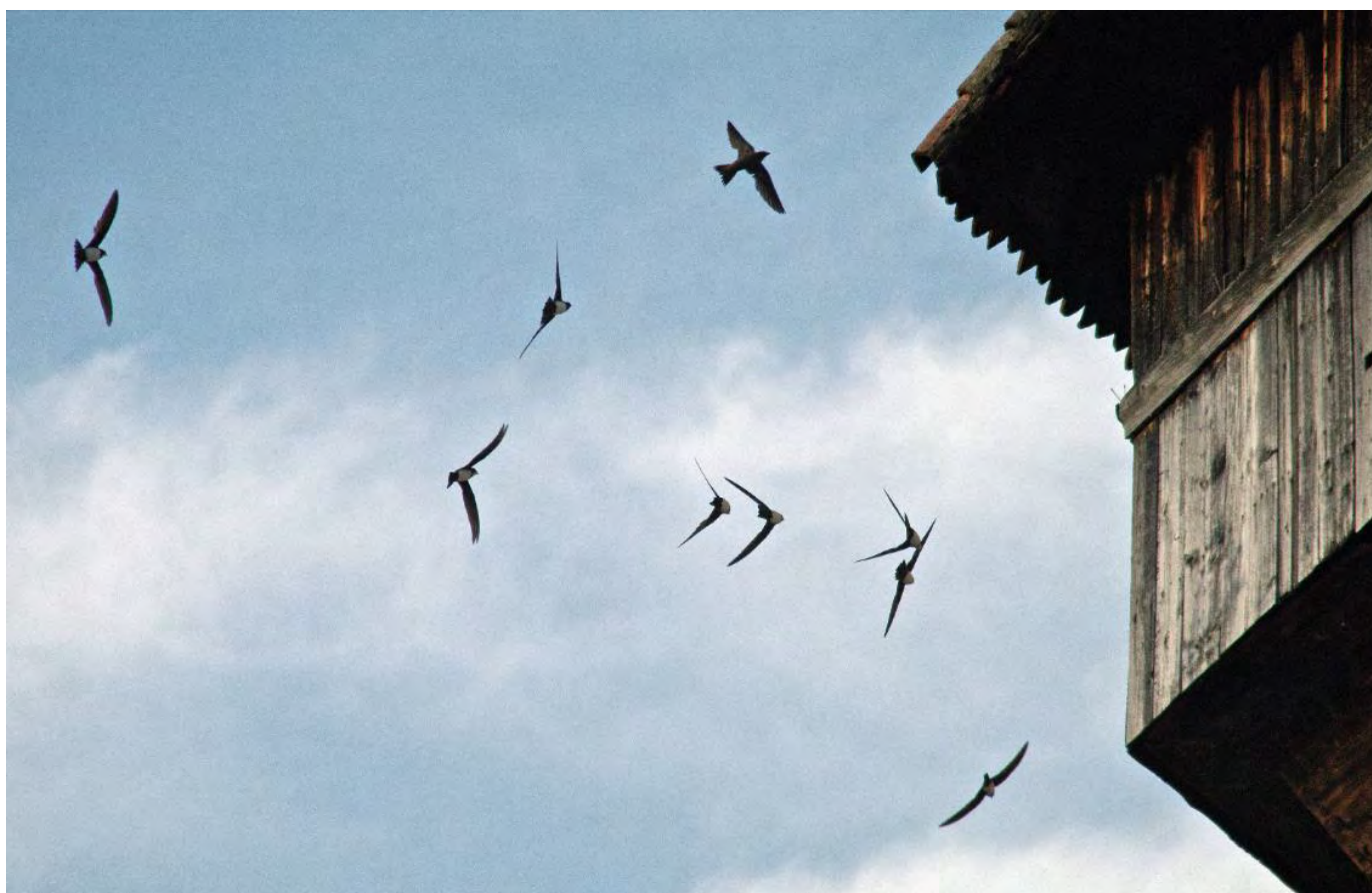
Alpengregler am Wasserturm