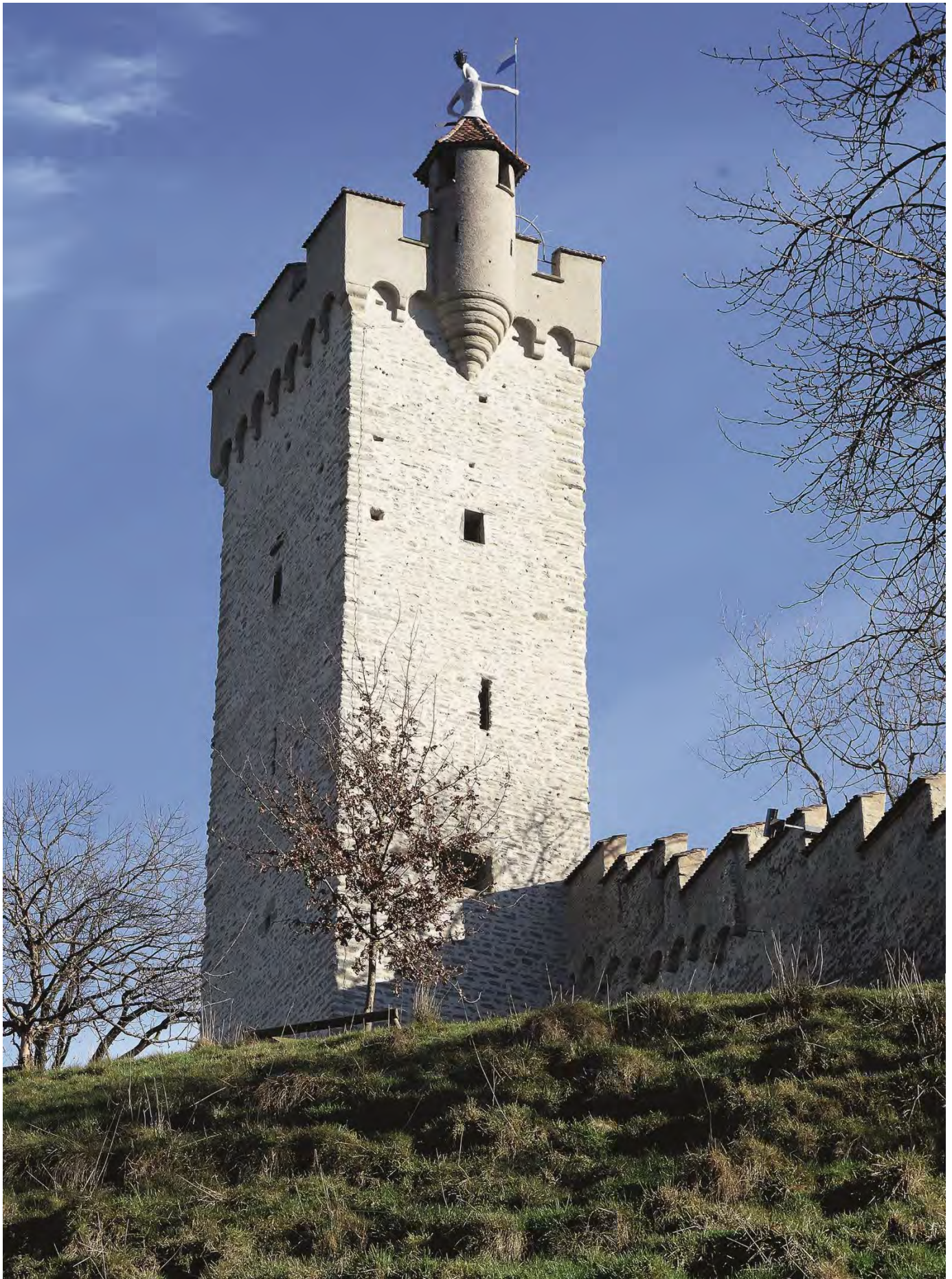
Männlerturm nach der Sanierung