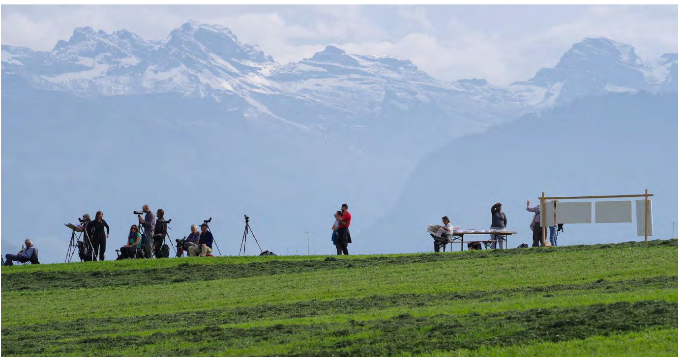
Die Beobachtungsstation auf dem Sonnenberg vor imposanter Kulisse