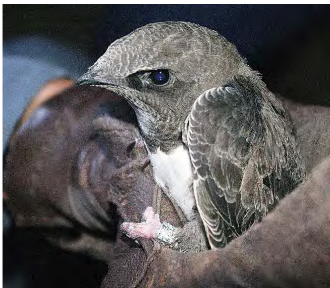
Portrait eines Alpengreglers