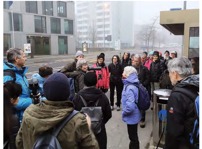
Besammlung am frühen Morgen

Dreissig Frühaufsteher fanden sich bei anfangs kühlwindigem Wetter und leichtem Nebel im Rotewald auf Stadtgebiet ein, um den bereits vielfältigen Stimmen zu lauschen und sich an der Rückkehr mancher Zieher zu erfreuen. Der erste Schwarzmilan zog über unsere Köpfe hinweg. Eindrücklich war das Balzgurren von vier Eichelhähern in der nahen Fichte. Die zwei Wasseramseln beim Stahlwerk haben das Rendez-vous nicht verfehlt, auch eine Gebirgsstelze liess sich bewundern. Insgesamt zeigten sich 28 Arten.