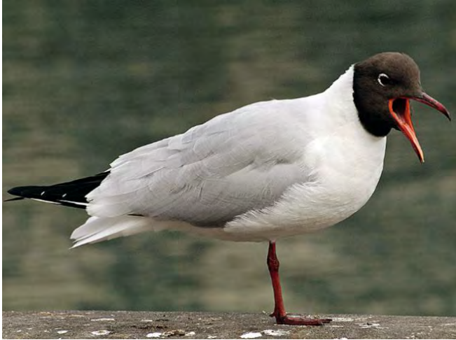
Lachmöwe