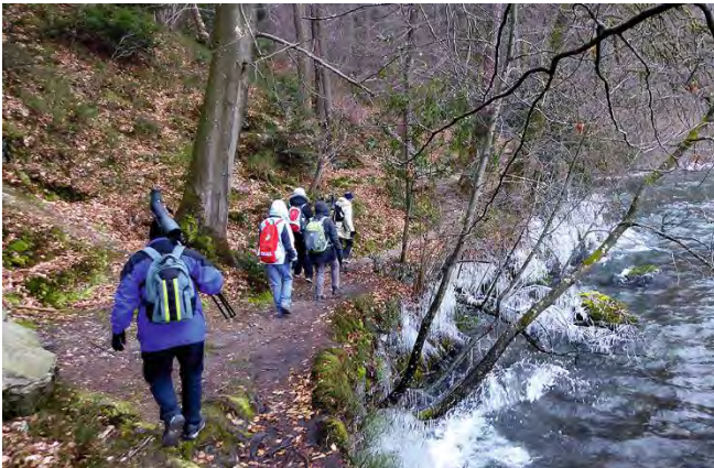
Romantischer Weg am Chiemen

Minustemperaturen und eine bissige Biese verwandelten das nördliche Seeufer beim Chiemen in ein bizarres Eiskunstobjekt. Auch das Haareis, das förmlich aus dem Boden wuchs, fand die Beachtung der acht Exkursionsteilnehmenden. Obwohl Wind und Kälte die Vögel von ihren Aktivitäten weitgehend abhielten, konnten 25 Vogelarten beobachtet werden, darunter ein Baumfalke und acht Schnatterenten.