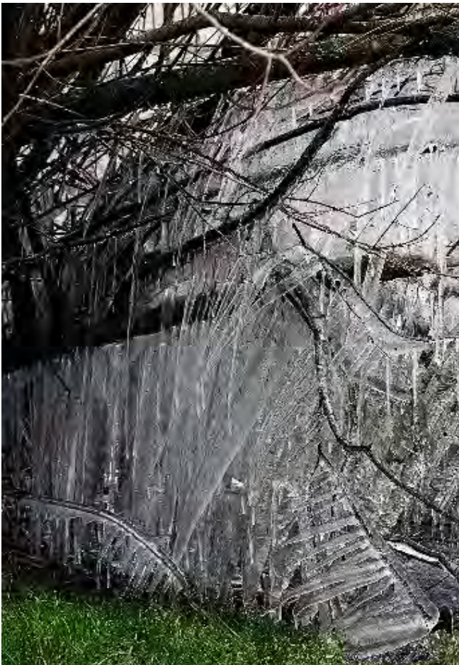
Eiskunst am Zugersee