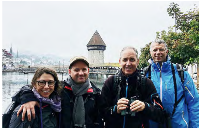
Das OGL-Team Wasserturmfalken

Das 28. Bird Race fand am 1. September statt. Viererteams versuchten, innert 24 Stunden möglichst viele Vogelarten zu finden. Erlaubte Fortbewegungsmittel waren dabei nur öffentliche Verkehrsmittel und die eigene Muskelkraft.