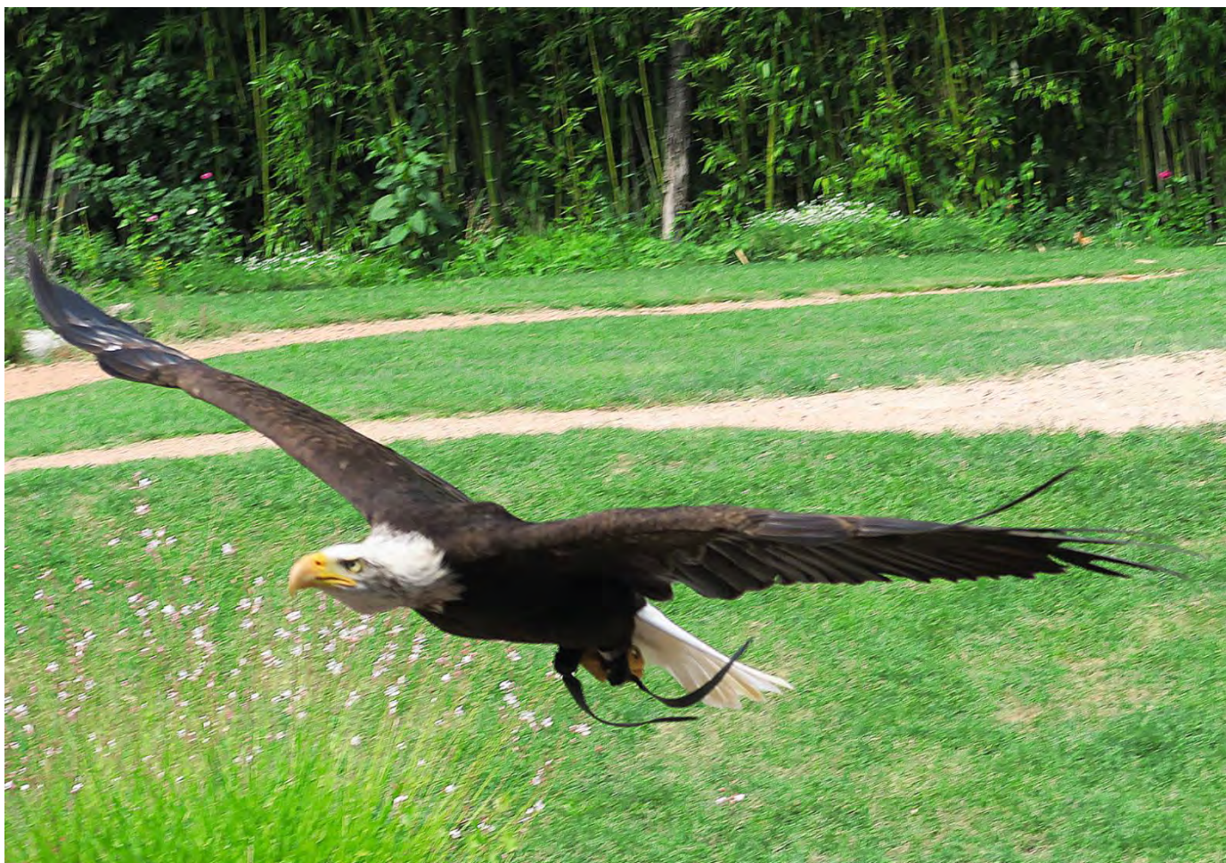
Weisskopfseeadler ( Haliaeetus leucocephalus ) Nordamerika Flugvorführung in der Falconeria Locarno

Wir danken allen Gönnermitgliedern für die grosszügigen Beiträge!