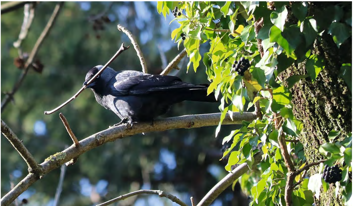
Bäume an der Museggmauer sind als Sitz wichtig

Die grosse Zahl von beobachteten Familien stützt die Vermutung, dass in gewissen Nisthöhlen nacheinander