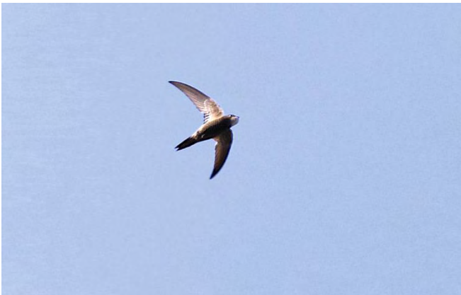
Fahlsegler an der Chiesa Sant'Antonio