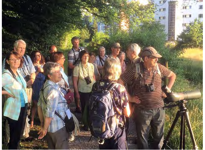
Die Teilnehmer des Spezialhock

Mittwoch, 20. Juni 2018, 17 Teilnehmende