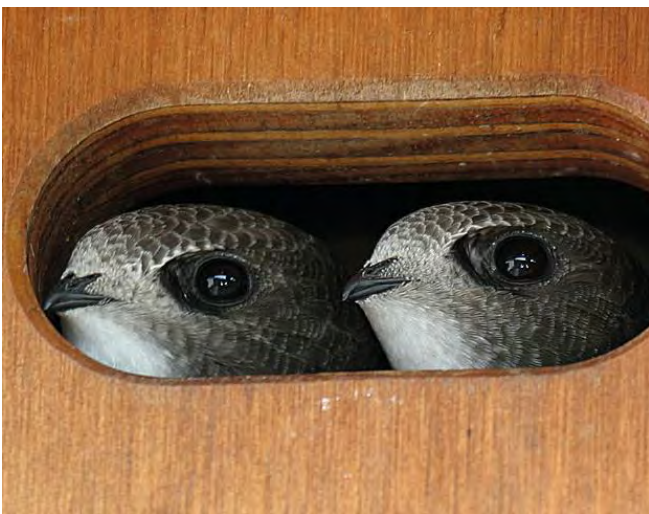
Zwei junge Mauersegler am Einflugloch

Zwischen Mai und Juli fanden wöchentlich spätabendliche gemeinsame Rundgänge in Quartieren statt, in denen Brutplatzvorkommen vermutet wurden, speziell wenn Dachsanierungen und Hausabbrüche anstanden. Zudem wurden systematisch Einzelbeobachtungen dokumentiert, so in einem sich als Hotspot erweisenden Dreieck zwischen Wesemlinkloster, -wäldli, und Dreilindenpark. In einem einzelnen alten Haus an der Sonnenbergstrasse konnten zahlreiche Brutplätze geortet werden. Festgestellt wurde ausserdem, dass in einer bereits 2016 dokumentierten Kolonie in einem älteren Mehrfamilienhausquartier mit durchgeführter Dachsanierung die gezielt angebrachten Einschupflöcher allmählich genutzt werden. Vielen Dank dem ganzen Team für die wertvolle Arbeit! UW