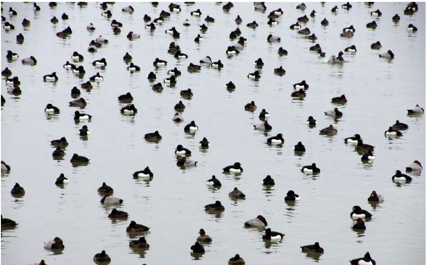
Reiher- und Tafelenten