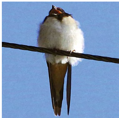
Junge Rauchschwalbe

Ein herzliches Dankeschön dem ganzen Schwalben-Team für die wertvolle Arbeit!