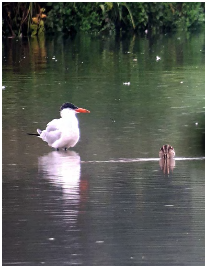
Highlight am Birdrace