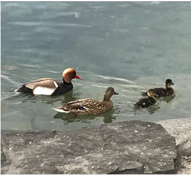
Kolbenentenerpel mit Stockentenweibchen