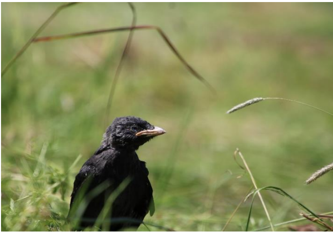
Soeben ausgeflogene Jungdohle