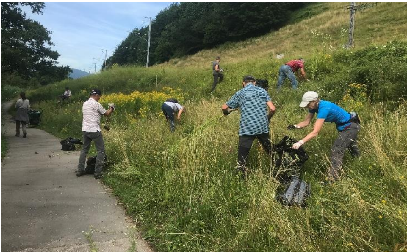
Das Team bei der Arbeit