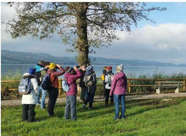
Eifrig wird beobachtet

Am Sempachersee ist der Eisvogel nach der Brutzeit regelmässig zu beobachten. Wer seinen hohen Ruf kennt, kann sich rechtzeitig auf den «fliegenden Edelstein» einstellen. Im November weilen oft auch Durchzügler und Wintergäste am Sempachersee.