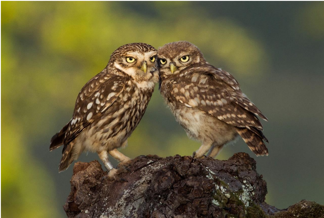
Steinkauz – Vogel des Jahres 2021