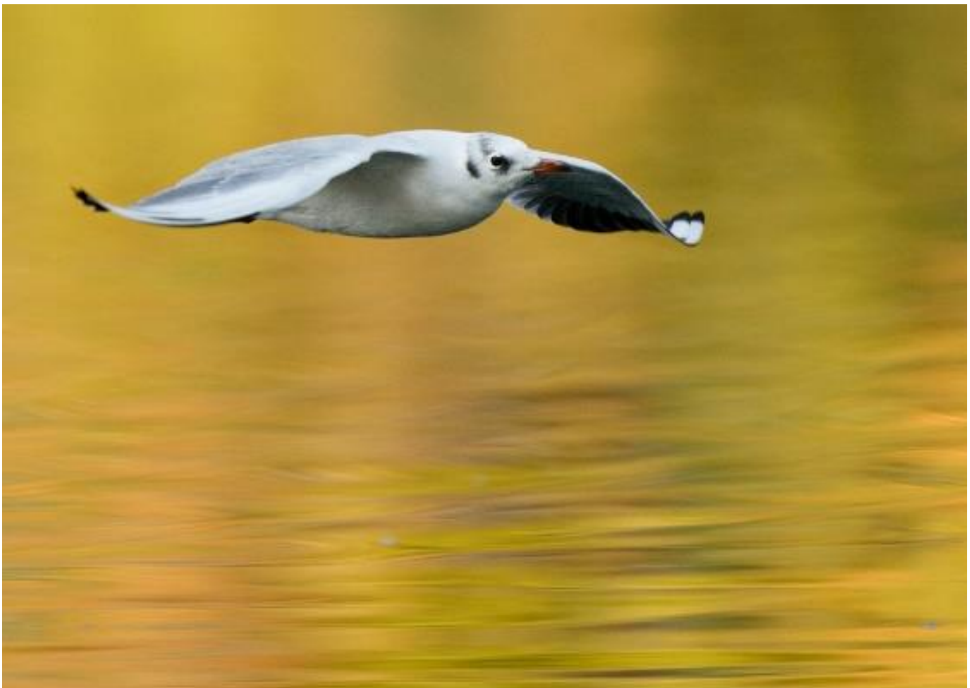
Lachmöwe im Schlichtkleid

Bei der Suchaktion am 13.12.2020 machten Ursula Winklehner und Bea Ess folgende Beobachtungen: Im Bereich Luzernersee/Kreuztrichter sammelte sich vor und während der Dämmerung ein Band von Lachmöwen, welches mehrere hundert Individuen umfasste. Das Band vergrösserte sich allmählich und bewegte sich Richtung Kreuztrichter. UW