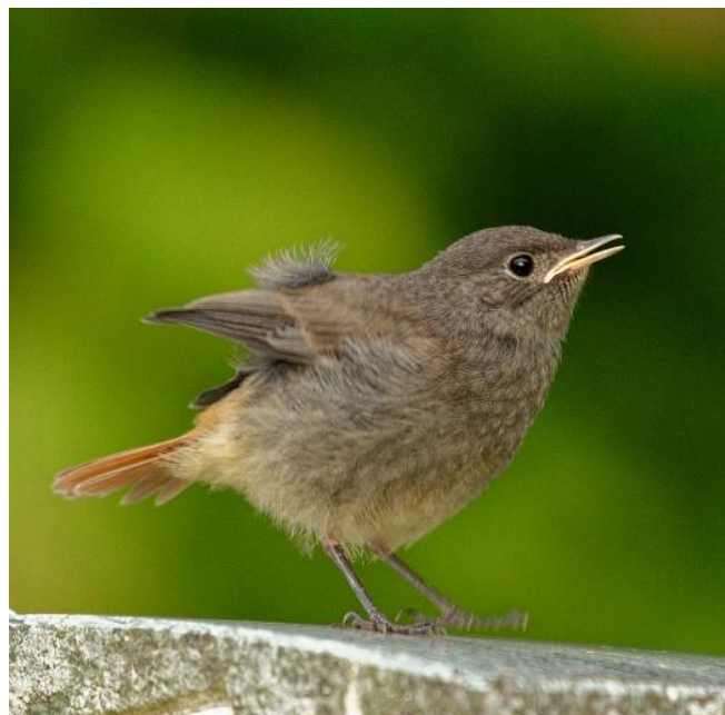
Junger Hausrotschwanz beim ersten Flugversuch