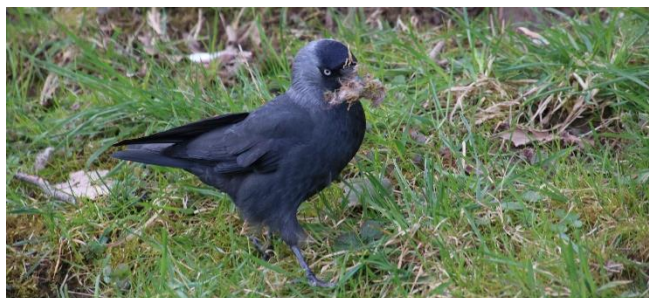
Dohle mit Nistmaterial