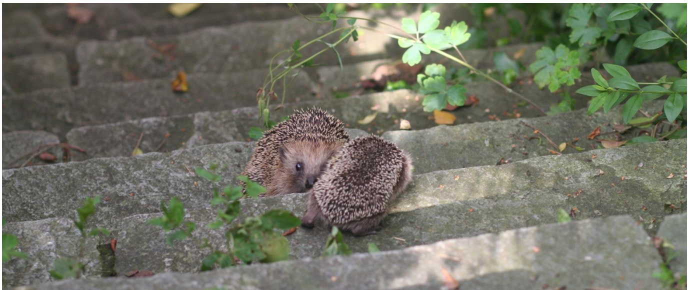
Igel in naturnahem Garten

Die Vogelschutzarbeit der OGL wurde von der Stadt Luzern mit einem Betrag von Fr. 600.00 unterstützt.