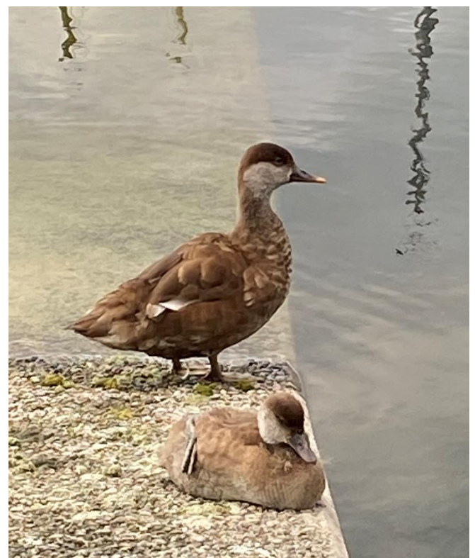
Kolbenentenfamilie (Foto: Luzia von Deschwanden)

Ein herzliches Dankeschön dem ganzen Team und den Personen, welche Sichtungen von Kolbenentenküken in Ornitho.ch eingetragen haben! AB/LVD