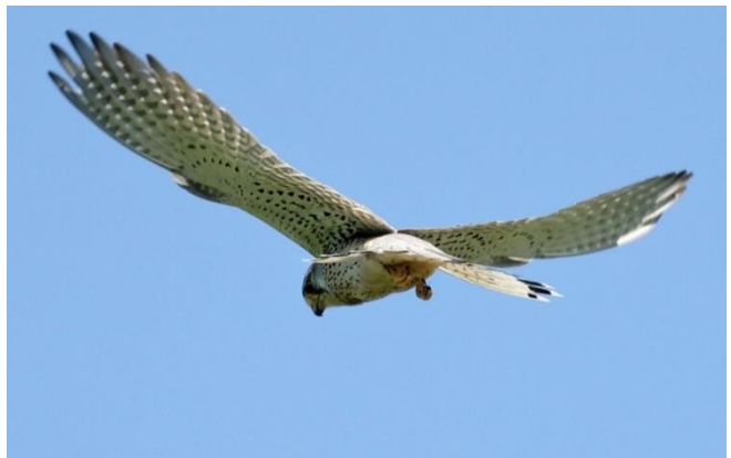
Turmfalk