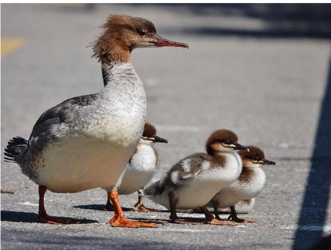
Gänsesägerfamilie auf dem Weg zum Wasser