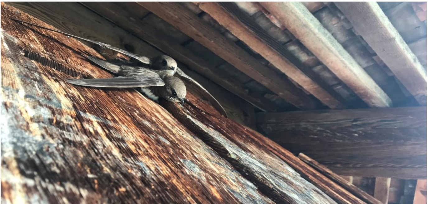
Aggressives Verhalten zweier Alpensegler an der Aussenseite des Wasserturms