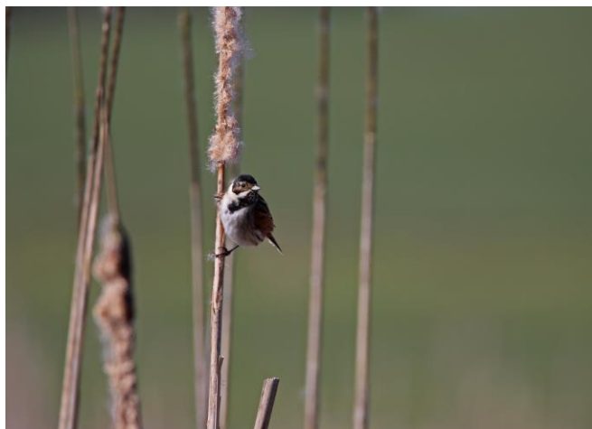
Rohrammer