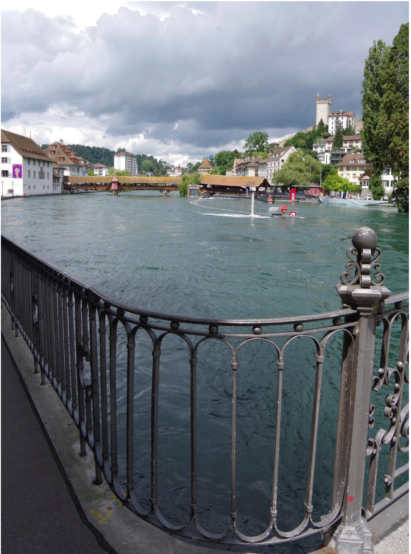
Hochwasser 2021 in Luzern