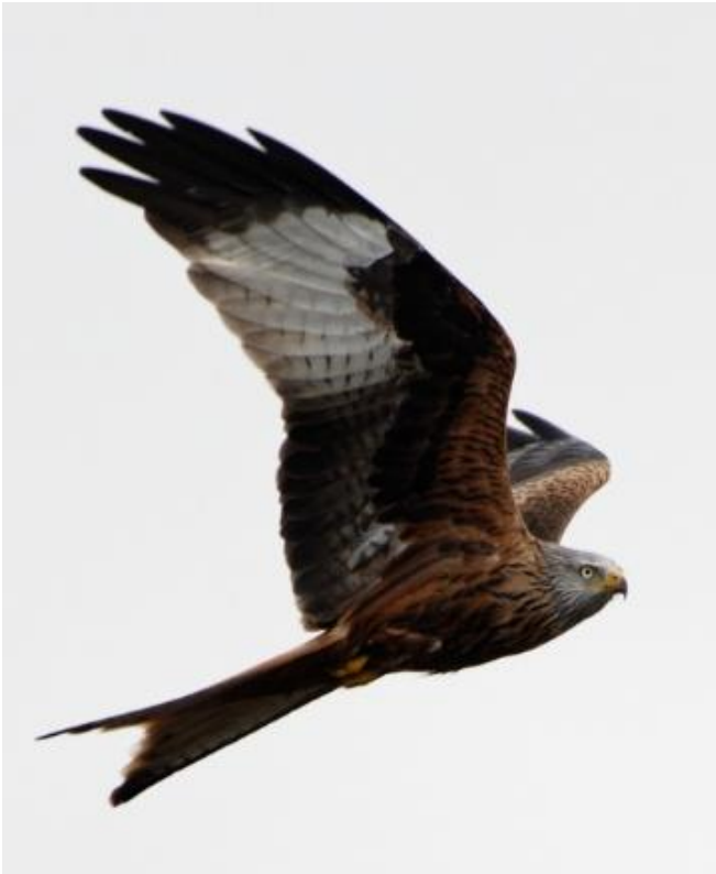
Rotmilan