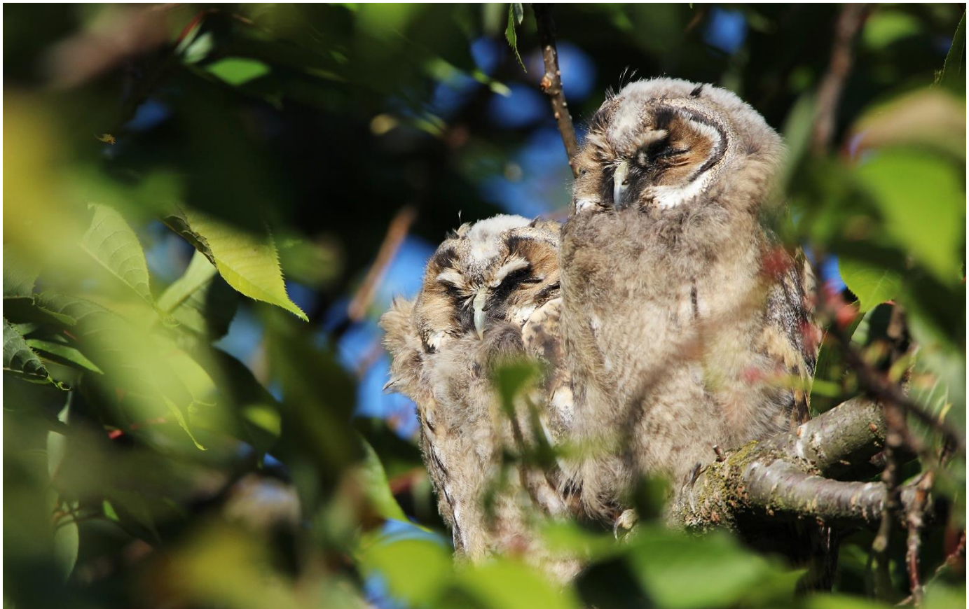
Junge Waldohreulen

Wir danken allen Gönnermitgliedern für die grosszügigen Beiträge!