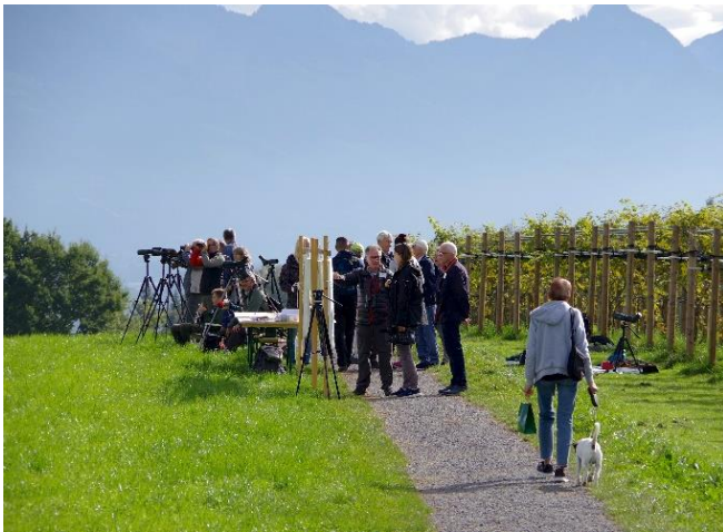
Auf dem Sonnenberg